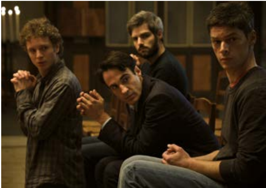
AINSI SOIENT-ILS (Saison 2)