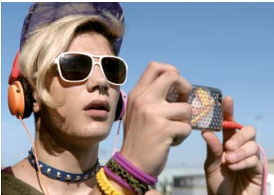
XENIA Réalisateur : Panos H. Koutras