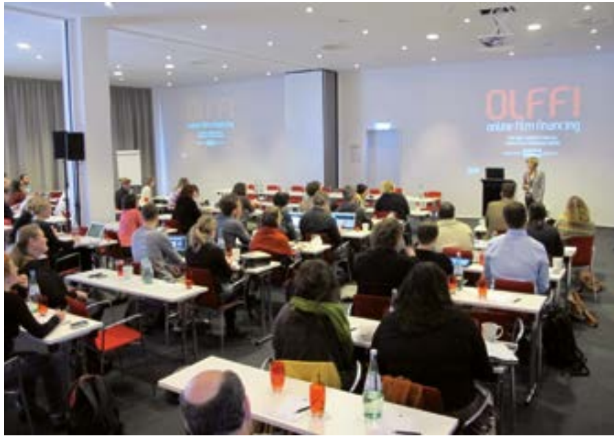
EAVE Producers' Workshop