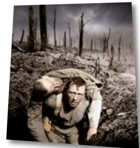
APOCALYPSE, LA 1 ère GUERRRE MONDIALE

Points supplémentaires : projets ciblant un jeune public, candidatures issues de pays à faible capacité de production, projets de coproductions entre partenaires MEDIA de langues différentes.