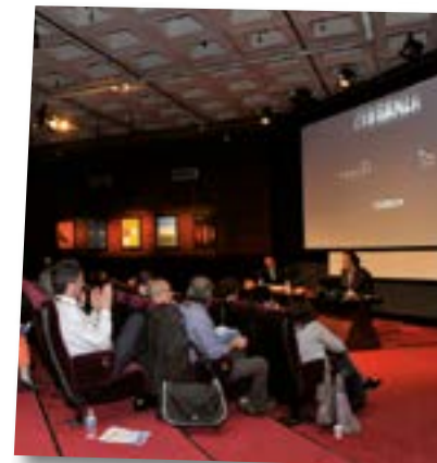
FESTIVAL SÉRIES MANIA - FORUM DE COPRODUCTION 2013