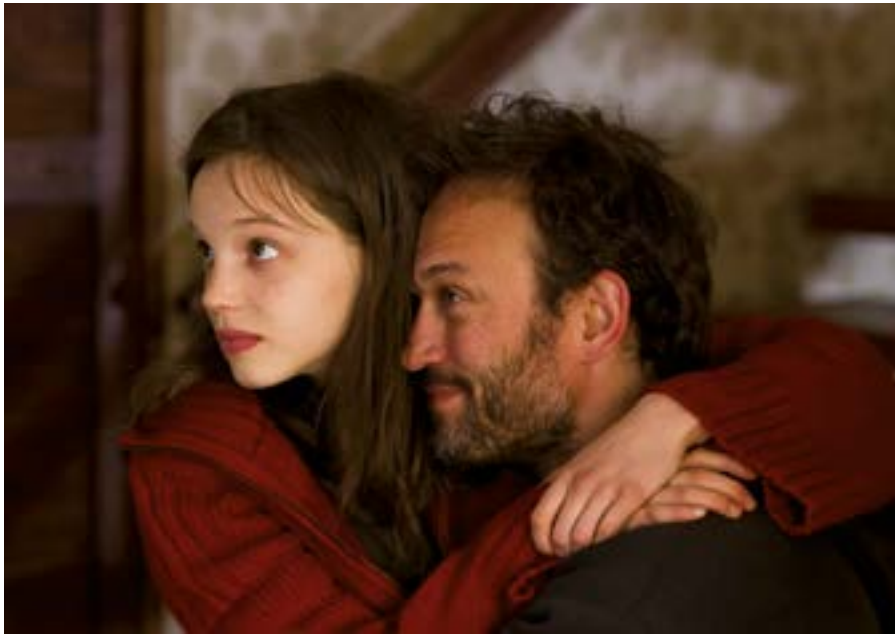
PUPPY LOVE Réalisatrice : Delphine Lehericéy