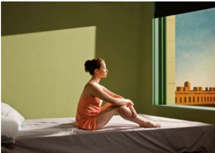
SHIRLEY: VISIONS OF REALITY Réalisateur : Gustav Deutsch