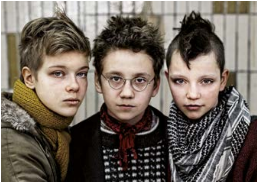
WE ARE THE BEST! Réalisateur : Lukas Moodysson © Memfis Film/P-A Jörgensen