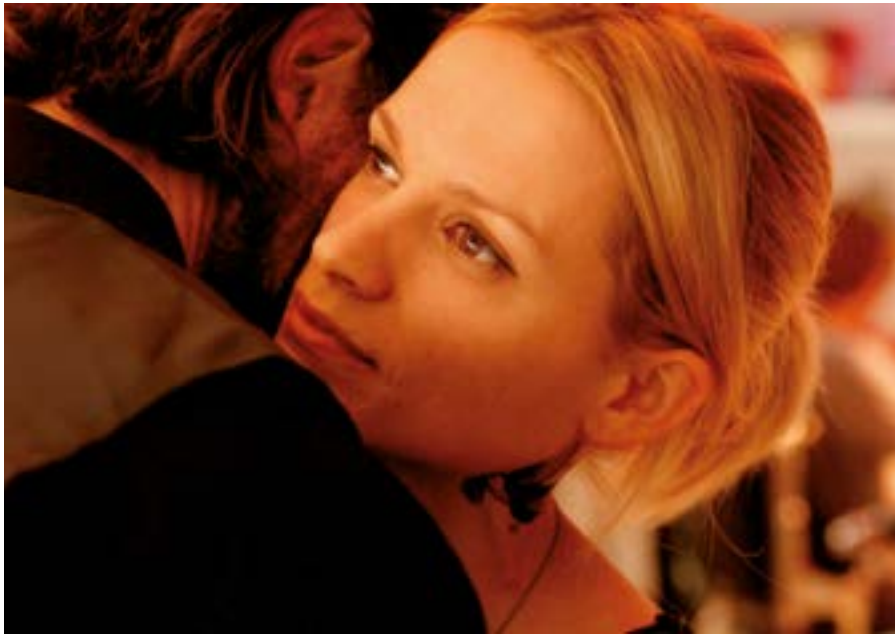
ALABAMA MONROE (THE BROKEN CIRCLE BREAKDOWN) Réalisateur : Felix Van Groeningen © Menuet