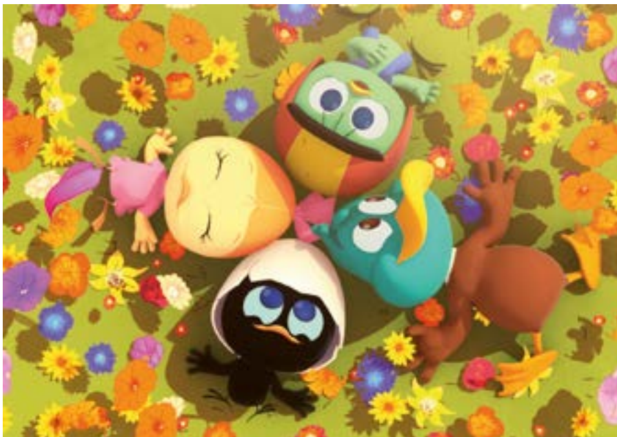
CALIMERO CGI