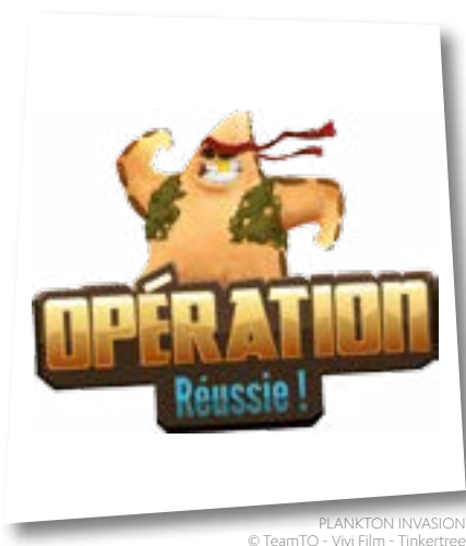
PLANKTON INVASION © TeamTO - Vivi Film - Tinkertree

Nouveau soutien initié par Europe Créative, cet appel dispose d'un budget global de 2,5 millions d'euros en 2014.