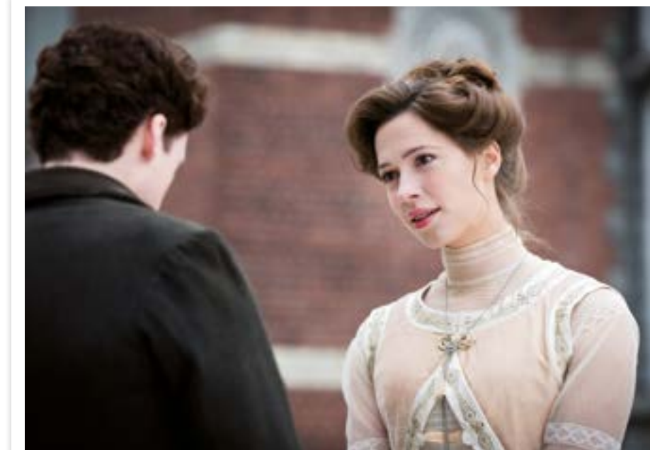
UNE PROMESSE Réalisateur : Patrice Leconte