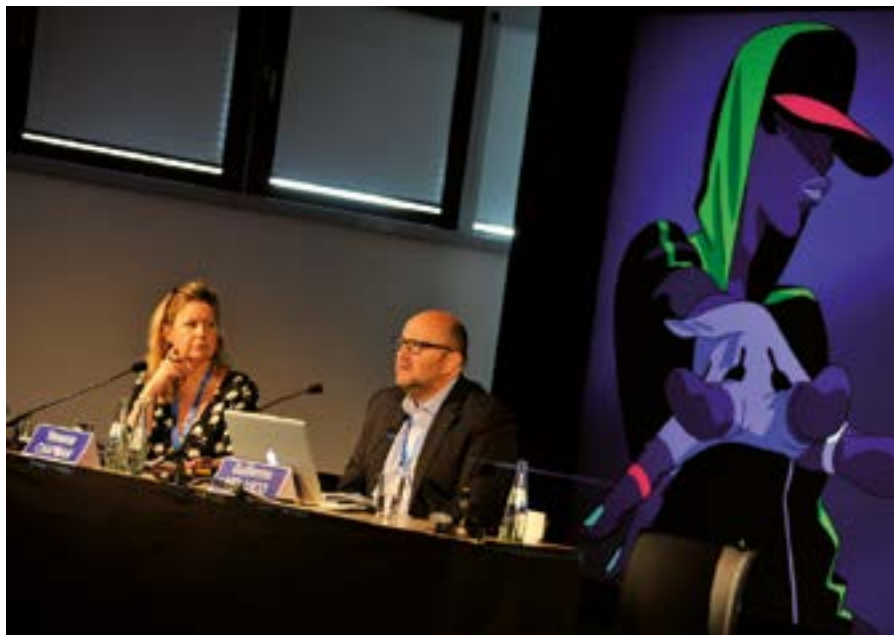
CARTOON 360 © Cartoon