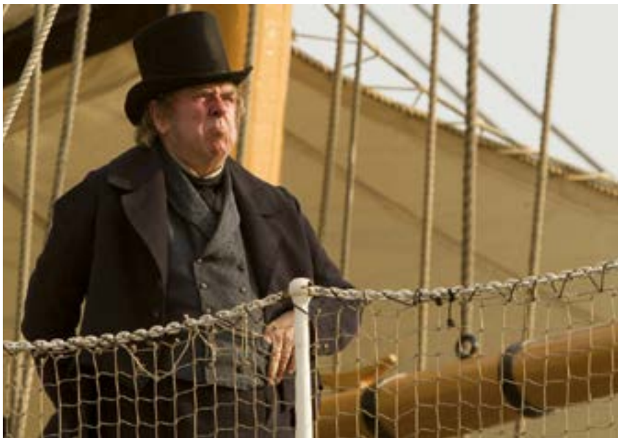
MR TURNER Réalisateur : Mike Leigh