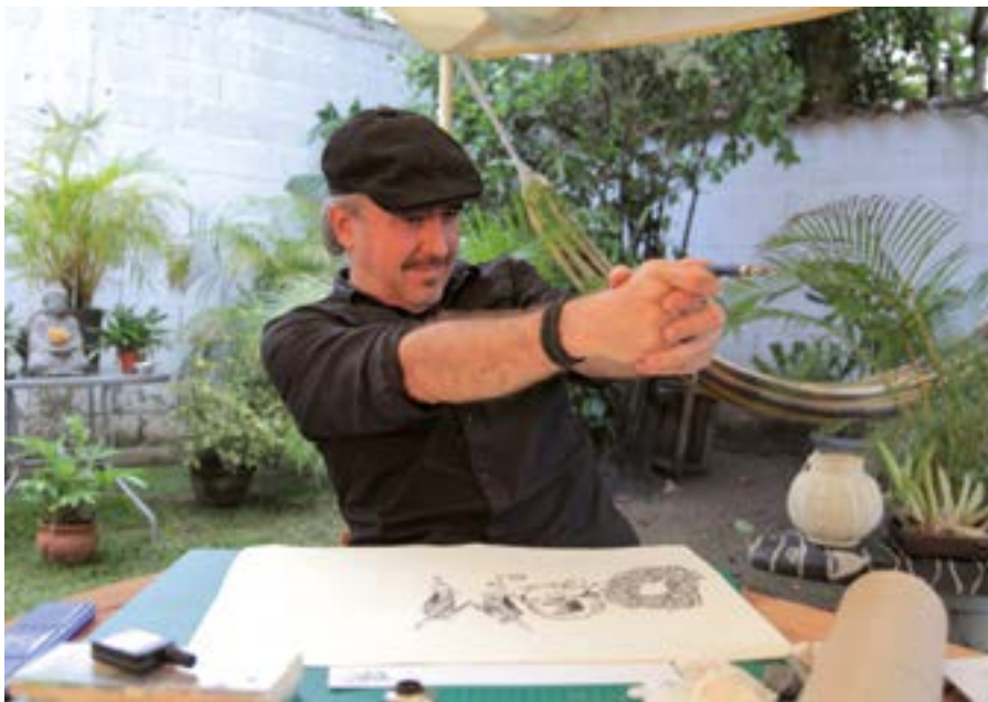
CARICATURISTES, FANTASSINS DE LA DÉMOCRATIE - Réalisatrice : Stéphanie Valloatto © Oi Oi Oi Productions, Cinextra Productions, Studio Orange, France 3 Cinéma, Panache Productions, La Compagnie Cinématographique, B-Movies