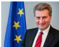
Günther H. Oettinger

Commissaire européen pour l'économie et la société numériques