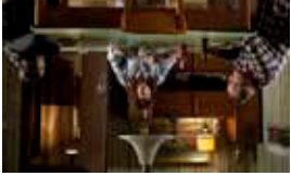
Le Tout Nouveau Testament