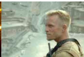
Ni le Ciel ni la Terre