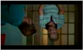
Un Etaj Mai Jos