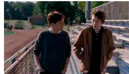
Louder Than Bombs