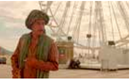
As mil e uma noites