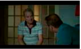
Un Etaj Mai Jos