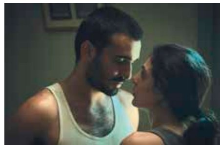
Une histoire de fou