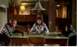
Le Tout Nouveau Testament