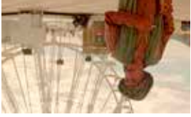
As mil e uma noites