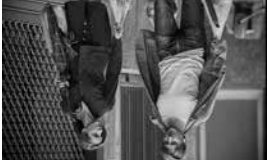
L'Ombre des femmes