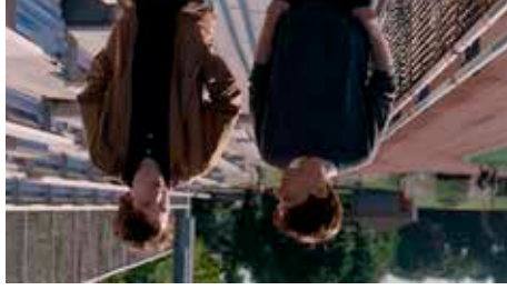
Louder Than Bombs