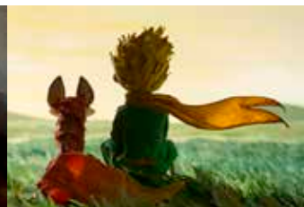
The Little Prince