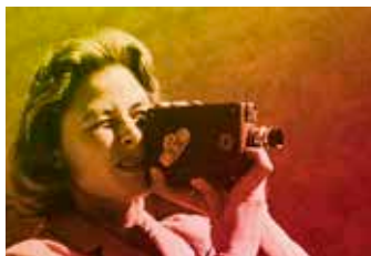
Jag Är Ingrid

Avec la révolution numérique, l'audiovisuel et le cinéma européens se sont déjà considérablement transformés notamment avec le soutien du programme Europe Créative-MEDIA. Depuis sa création en 1991, MEDIA a en effet permis de former plus de 20 000 producteurs, distributeurs, réalisateurs et scénaristes et de les aider à s'adapter aux nouvelles technologies. MEDIA, c'est aussi chaque année environ 2 000 projets soutenus afin de développer, promouvoir et distribuer des films, séries télévisées ou autres œuvres audiovisuelles européennes diffusés en numérique au cinéma, à la télévision ou en vidéo à la demande. Cette année, 25 films soutenus par MEDIA ont été sélectionnés, un record.