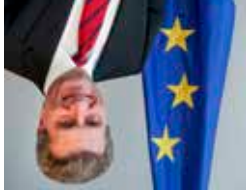
Günther H. Oettinger European Commissioner for Digital Economy and Society

"It is both an honour and a pleasure for me to take part in the Cannes Film Festival for the first time.