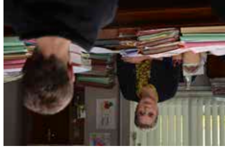
La Tête haute

Under the auspices of the European Film Forum which was launched this year, the European Commission has organised a series of meetings in Cannes with the professionals, creators and heads of companies contributing to the dynamism and diversity of the European audiovisual industry. These events aim to allow the Commission, represented by Commissioner Günther H. Oettinger, to exchange views with the professionals and other stakeholders on the current developments in the audiovisual sector.