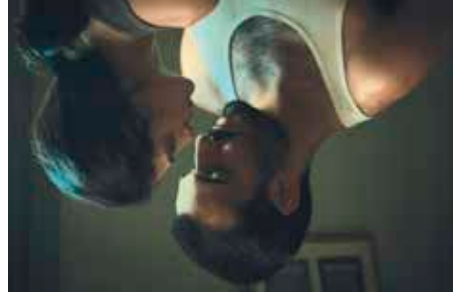
Une histoire de fou