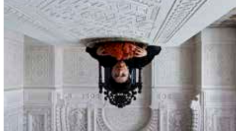
Il Racconto dei Racconti