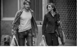
L'Ombre des femmes