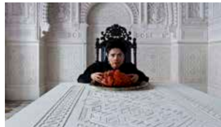
Il Racconto dei Racconti